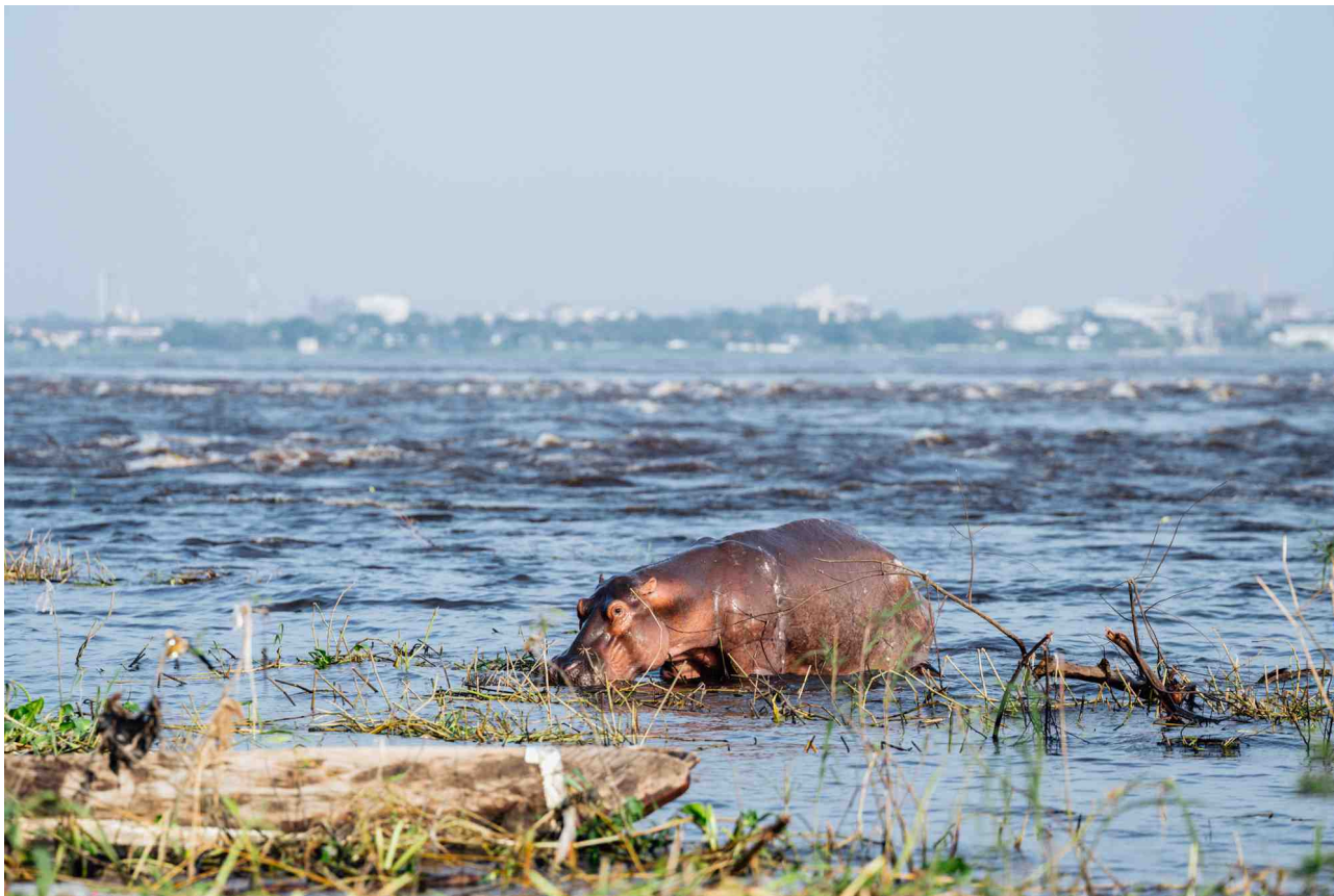
Soliterní hroch „uvězněný“ mezi velkoměsty Kinshasa a Brazzaville

Před skončením této mise jsme v metropoli Brazzaville zdokumentovali stav soliterně žijícího samce hrocha na soutoku řek Djoué a Congo, zaznamenali jeho snad nepříliš vážná poranění z dřívějších a s pověřenými osobami diskutovali o případné budoucí možnosti toto problematické zvíře přesunout do rezervace Tsoulou, kde je skupina hrochů již velmi zredukována pytláctvím a v současnosti máme vlastním pozorováním jasně potvrzenou přítomnost jen dvou jedinců (neznámého pohlaví a příbuznosti) v řece Niari/Modré řece.