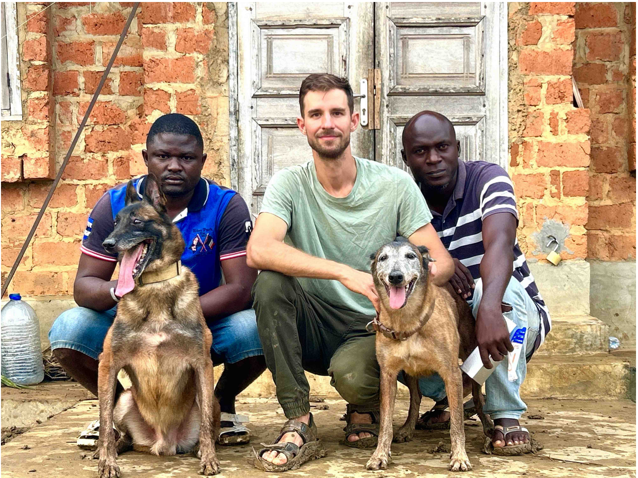
První den přijetí bývalých detekčních psů Charma a Doli na jejich klidný psí důchod na periferii Tsoulou

V únoru bohužel došlo k autohavárii půjčené Toyoty Hilux při řízení jedním z našich kolegů. Terénní vůz jsme měli půjčený po dobu terénních misí s Benem Cristovao a při předposledním dni a přesunu (pouze řidič a žádný spolucestující uvnitř auta ani na korbě) došlo k nehodě, která mohla být fatální. Naštěstí se našemu kolegovi nic nestalo. To však nejde říci o Toyotě, která byly v důsledku opuštění silnice a převrácení přes střechu zcela zdemolována. Přežil pouze motor, který se dalo zachránit, vyjmout a přenést na podvozek a do karoserie jiné nepojízdné, avšak nehavarované Toyoty. Řešením tohoto, jakož i umořením dluhu za nepřiměřeně dlouhé půjčovné nám vznikla hluboká finanční krize, která bude mít důsledky i pro další měsíce našeho fungování.