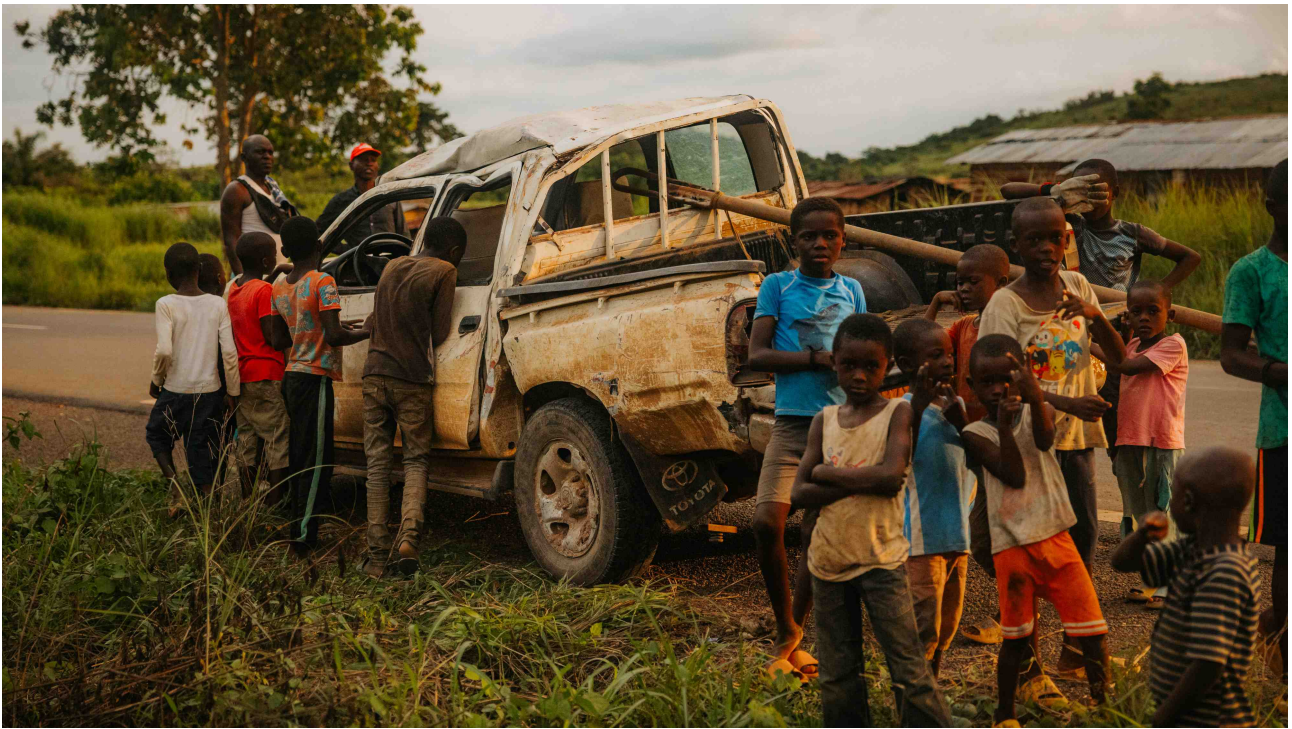
Téměř kompletně zničená Toyota Hilux v důsledku nehody na periferii Tsoulou

V příloze tohoto reportu přikládáme i updatovanou verzi naší současné databáze identifikačních karet slonů pralesních, které v prostoru rezervace Tsoulou a blízké periferie pomocí fotopastí mapujeme. Pomocí znaků na klech, uších a tělech slonů dokážeme v tuto chvíli individuálně rozlišit 12 slonů, přičemž další řada fotek a videí z fotopastí nám neumožňuje říci, zda se jedná o tytéž nebo další jedince. Je pozoruhodné, že podle všeho jsou zatím všichni poznaní jedinci dospělí samci, přestože podle otisků stop a svědectví lidí se v oblasti vyskytují též skupinky samic se slůňaty. Druhou pozoruhodností je též přítomnost dvou slonů zcela bez klů. U jednoho jedince jsme bohužel na zatím jediném videu z fotopasti odhalili zranění na distální části chobotu, způsobené pravděpodobně dřívějším zachycením se do drátěného oka nastraženého na lov menších zvířat na bushmeat.