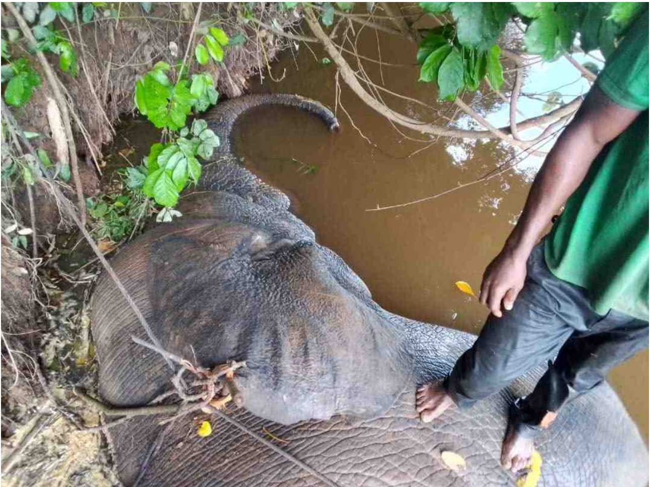
Sloní mršina (patrně přirozeně bez klů) na břehu řeky Niari přímo v rezervaci Tsoulou