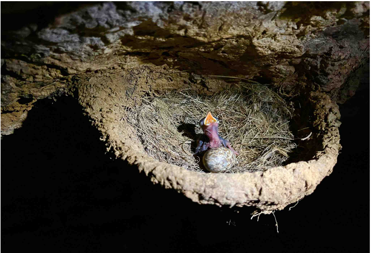
Mládě a vejce v jeskynním hnízdě vzácné vranule šedokrké v Passi Passi

Během mise se také podařilo odhalit živého luska bledobřichého v držení pytláka a vypustit jej zpět do přírody na úpatí pohoří Mayombe JZ od rezervace Tsoulou.